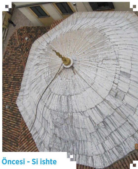
Öncesi - Si ishte

İki ülkenin ortak tarihi ve kültürü açısından önemli bir yere sahip olan Ethem Bey Camii'nin korunarak gelecek nesillere aktarılması için Cumhurbaşkanımız Sayın Recep Tayyip Erdoğan'ın talimatlarıyla TİKA tarafından kapsamlı bir restorasyon çalışması başlatılmıştır. 2018 yılında başlayan çalışmalar 2021 yılında tamamlanmıştır.