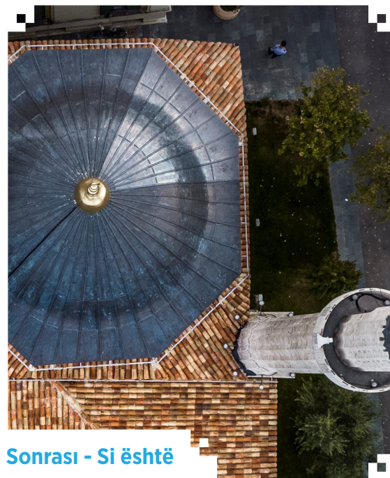
Sonrası - Si është

Me qëllim ruajtjen dhe trashëgimin tek brezat e ardhshëm të Xhamisë së Et'hem Beut, e cila ka një vend të rëndësishëm në historinë dhe kulturën e përbashkët të dy vendeve, me udhëzimet e Presidentit tonë, Z. Recep Tayyip Erdoğan filloi restaurimin gjithëpërfshirës nga TİKA. Punimet e nisura në vitin 2018 përfunduan në vitin 2021.