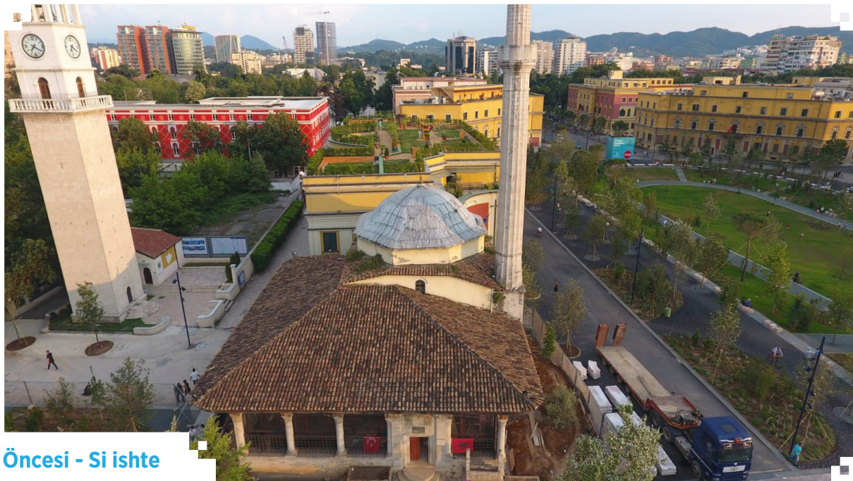
Öncesi - Si ishte

Mimarisi bakımından Osmanlı dönemi Türk yapı sanatı usullerine uygun olan bu eşsiz eser gerek harim mekânını gerekse son cemaat mahalini kaplayan kalem işi renkli bezemeler ve resimlerle Balkanlar'da çok yaygın olan bir sanat anlayışına sahip. Hemen yanı başındaki bir