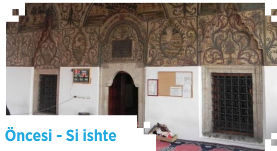
Öncesi - Si ishte