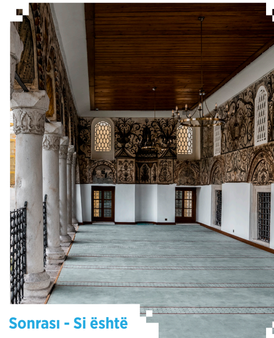
Sonrası - Si është

Konservasyon ağırlıklı restorasyon uygulamasıyla, cami içindeki kalem işleri ve bezemeler sağlamlaştırılarak itinayla temizlenmiştir. 2021 yılında tamamlanan çalışmalar kapsamında caminin kubbe ve minaresindeki kurşun kaplamaları ile çatısı yenilenirken, yapısal sağlamlaştırma ve çevre düzenlemesi çalışmaları da gerçekleştirilmiştir. Gündüzleri bir cevher gibi Tiran'ı süsleyen tarihi yapı, gerçekleştirilen dış cephe aydınlatma sistemiyle geceleri de tüm zarafetiyle gözleri kamaştırmaya devam etmektedir.