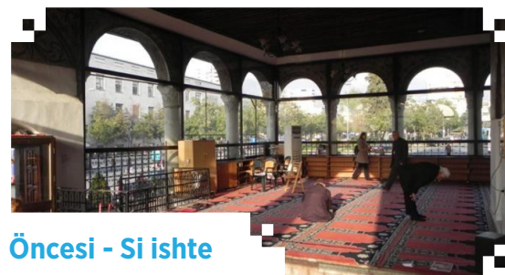
Öncesi - Si ishte

Konservasyon ağırlıklı restorasyon uygulamasıyla, cami içindeki kalem işleri ve bezemeler sağlamlaştırılarak itinayla temizlenmiştir. 2021 yılında tamamlanan çalışmalar kapsamında caminin kubbe ve minaresindeki kurşun kaplamaları ile çatısı yenilenirken, yapısal sağlamlaştırma ve çevre düzenlemesi çalışmaları da gerçekleştirilmiştir. Gündüzleri bir cevher gibi Tiran'ı süsleyen tarihi yapı, gerçekleştirilen dış cephe aydınlatma sistemiyle geceleri de tüm zarafetiyle gözleri kamaştırmaya devam etmektedir.