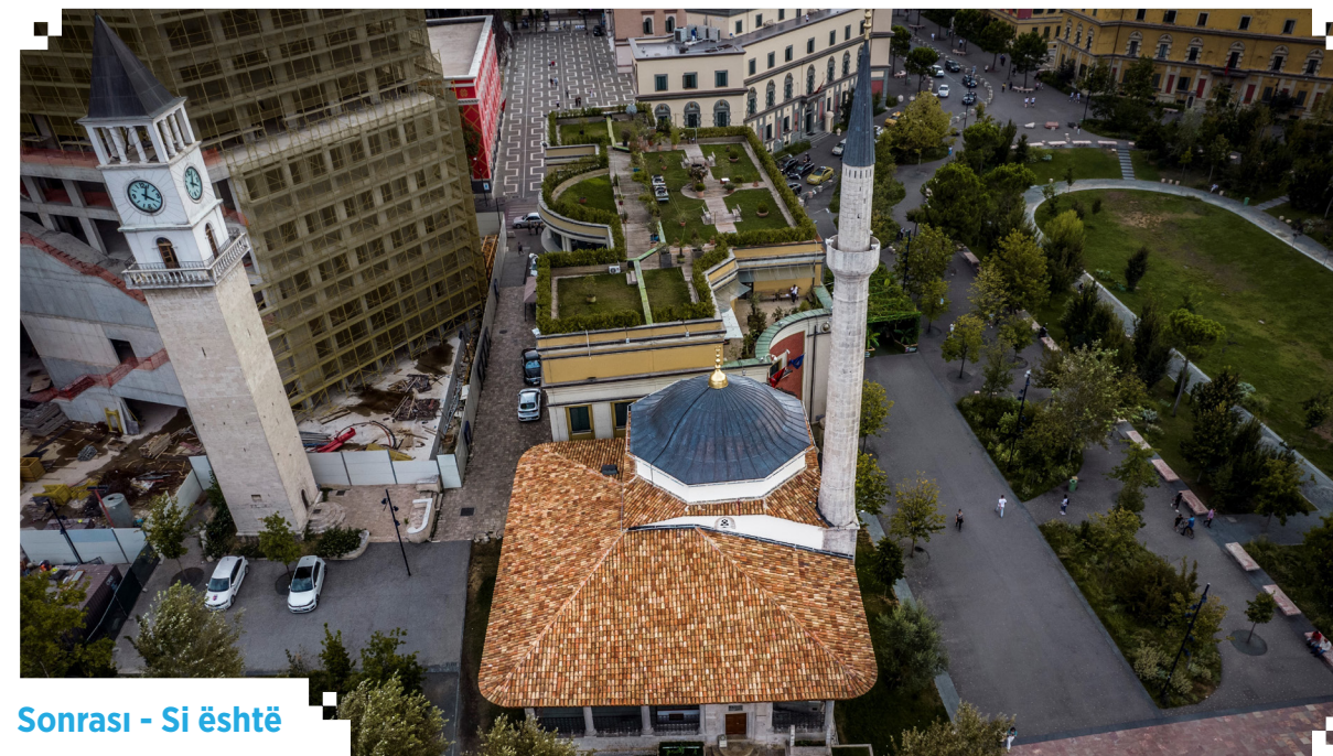
Sonrası - Si është

me Kullën e Sahatit, një tjetër vepër e periudhës osmane, është shpallur monumenti kulturor i kategorisë së parë. Xhamia, e cila u restaurua në vitet 1870 dhe 1985, u mbyll për shërbime fetare në periudhën 1967-1991 dhe u hap përsëri për adhurim në 1991.