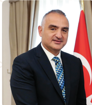
Mehmet Nuri ERSOY T.C. Kültür ve Turizm Bakanı